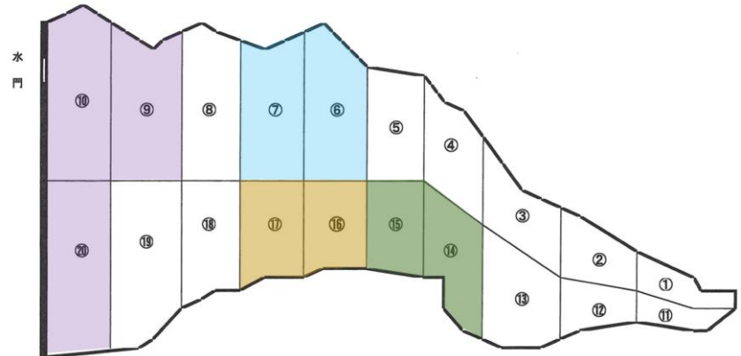
あさり貝蓄養漁場図(天草・松島区)